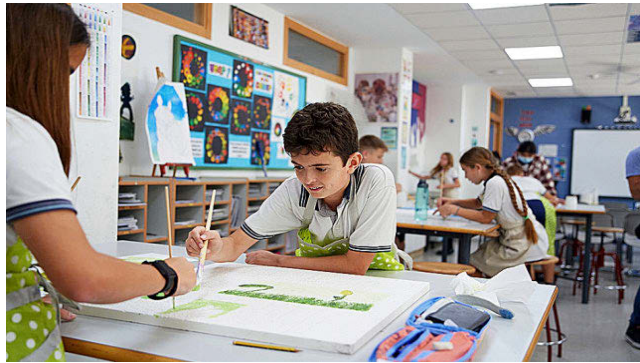
BRITISH SCHOOL VILA-REAL