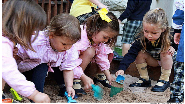
BRITISH SCHOOL ALZIRA

El próximo curso abrirá sus puertas el nuevo centro preuniversitario BSV Nexus, para alumnos de 16 a 18 años y con 1.800 metros cuadrados de superficie, ubicado a sólo 10 minutos a pie de su sede principal. El plan de estudios del centro se basa en el currículo británico. Hace hincapié en la responsabilidad y la organización del alumno, potenciando en el tanto el pensamiento crítico como el esfuerzo constante. Además de inglés y español, desde Year 5 introduce el francés como tercera lengua extranjera, mientras que los alumnos de Secundaria pueden elegir entre alemán o chino mandarín.