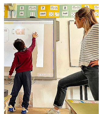
LYCÉE FRANÇAIS MURCIA

Además de establecer como valores fundamentales la laicidad y la igualdad de los individuos y proporcionar respuestas pedagógicas adaptadas, su sistema pivota sobre otros tres principios fundamentales: trabajo por competencias, proyectos y aprendizaje experiencial. Trabaja la interculturalidad a través de intercambios con centros de Francia (París y Estrasburgo), Túnez, Roma, Países Bajos, Alemania, Polonia, Bélgica y Luxemburgo. Acaba de obtener el sello E3D, siendo el primer centro de Murcia en lograr esta distinción del Ministerio de Educación francés.