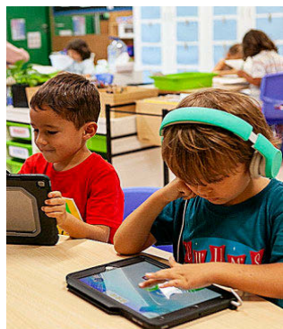
AMERICAN SCHOOL BARCELONA

Este colegio, cuyo director ha sido distinguido con el premio MBE (Miembro de la Orden del Imperio Británico) por sus servicios a la educación británica en España, proporciona una experiencia educativa basada en el modelo anglosajón, un programa trilingüe (inglés, español y francés o alemán) y un sólido sistema de valores que atiende a las necesidades individuales de los alumnos. Los estudiantes de último curso pueden optar por el Bachillerato español, los A-Levels o una ruta mixta de los dos anteriores. Además, todos se presentan a los exámenes de inglés de Cambridge.