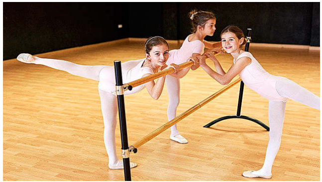
KING'S COLLEGE ALICANTE

Este colegio abrió sus puertas en Alicante en el año 2.000 y fue pionero en la ciudad en impartir una educación británica integral. Se trata, también, del único centro de la región que, de forma regular, se somete a inspecciones externas certificadas por el Departamento de Educación del Gobierno Británico. En su último informe, el colegio ha sido calificado como Excepcional en todas las categorías. El deporte y las artes son algunos de los pilares fundamentales de su enseñanza, motivo por el que forman parte del programa de estudios y se promueven a través de actividades y eventos.