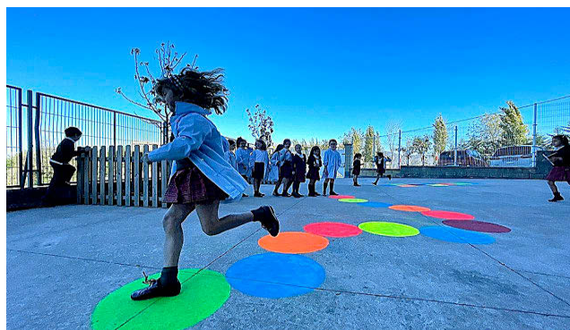
LYCÉE FRANÇAIS BILBAO

Potencia el dominio de la lengua y la cultura alemanas, a la vez que fomenta las propias de España. También otorga una especial relevancia al idioma inglés, al igual que al francés y el euskera. Cuenta con un nuevo edificio de Secundaria que se caracteriza por su sostenibilidad y alberga aulas, biblioteca con espacios diferenciados, salas de reuniones o terraza. Además, ha realizado obras para eliminar las barreras arquitectónicas en todos sus edificios y está construyendo un nuevo polideportivo. Ha ampliado su oferta educativa con la apertura de una guardería para niños de 1 y 2 años.