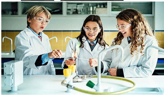
INTERNATIONAL SCHOOL OF MADRID

Este prestigioso colegio internacional se estableció en el año 1971 y cuenta actualmente con seis campus en la ciudad de Madrid. Imparte el currículo británico para los alumnos de entre 2 y 18 años, incluyendo las exámenes de IGCSE, AS & A-Levels y el Programa IB. El centro pone el énfasis en los conceptos más básicos, sobre todo, en Lengua y Matemáticas. También otorga especial importancia a la creatividad, el desarrollo del pensamiento crítico y la imaginación. Con el inglés como lengua vehicular, se estudia en otros dos idiomas más (español y francés).